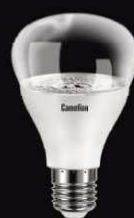
12 770 / LED15-PL/BIO/E27 [Эл.лампа светодиодная для растений 15Вт 220В] 13 241 / LED10-PL/BIO/E27 [Эл.лампа светодиодная для растений 10Вт 220В]