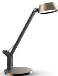
12999 / Camelion KD-835 C28

** Для минимизации риска клиентов мы гарантируем проведение переоценки товаров, закупленных в акционный период, в случае снижения отпускных цен на 10% и более в период действия акции.