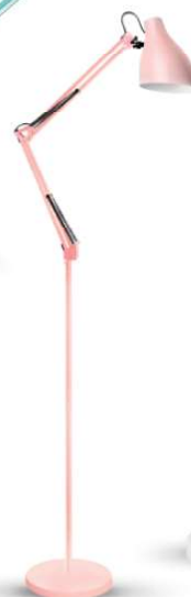
13882 / Camelion KD-332 C14