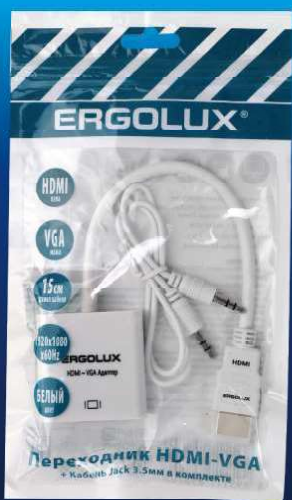
15297 / ELX-VA01P-HDMI