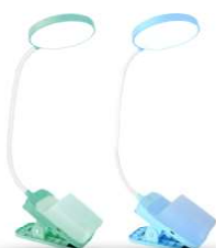
14487 / Ultraflash UF-751 C05 14488 / Ultraflash UF-751 C13