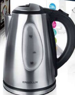
13 447 / ELX-KS04-C72 матово-черный PRO