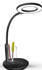
14146 / Camelion KD-826 C02