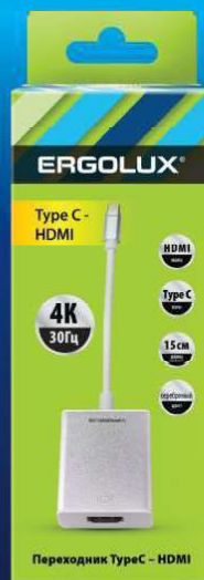
15300 / ELX-VA01-Type C