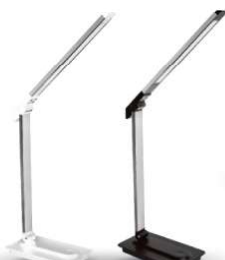
14155 / Camelion KD-846 C01 14156 / Camelion KD-846 C02