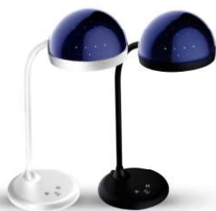
13006 / Camelion KD-828 C01 13007 / Camelion KD-828 C02