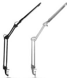
13527 / Camelion KD-821 C02 13528 / Camelion KD-821 C03