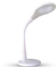
12484 / Camelion KD-790 C01