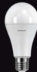
12 150 / LED-A60-12W-E27-3K [Эл.лампа светодиодная ЛОН 12Вт E27 3000К 180-240В] 14 228 / LED-A65-25W-E27-6K [Эл.лампа светодиодная ЛОН 25Вт E27 6500К 180-240В]