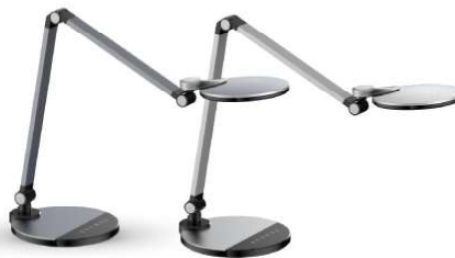
13400 / Camelion KD-865 C03 13403 / Camelion KD-865 C48