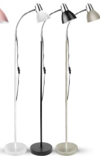
15187 / Camelion KD-359F C01 15188 / Camelion KD-359F C02 15189 / Camelion KD-359F C26