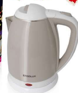
13 121 / ELX-KS02-C18 бежево-белый