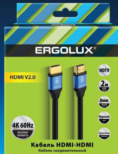
15299 / ELX-VC01-HDMI