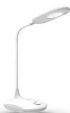
13779 / Ultraflash UF-711 C01

В период проведения школьной акции С 1 ИЮНЯ ПО 30 СЕНТЯБРЯ клиент получает дополнительную скидку 7% к указанным выше скидкам на 36 популярных артикулов настольных светильников Camelion и Ultraflash!