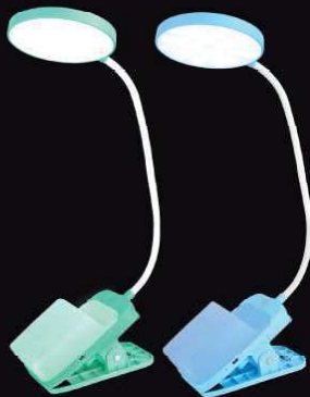
14 487 / UF-751 C05 зеленый 14 488 / UF-751 C13 голубой [Led, светильник настольный, 7Вт, 3 цвет.темп., 3 ур. яркости, аккумуля.]