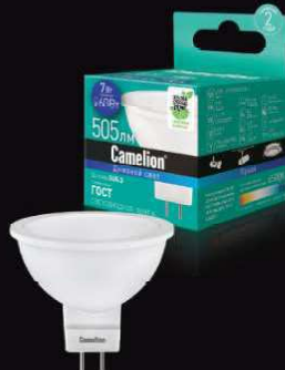
12 650 / LED7-JCDR/865/GU5.3 [Эл.лампа светодиодная 7Вт 220В]