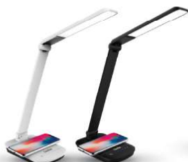
14161 / Camelion KD-825 C01 14162 / Camelion KD-825 C02