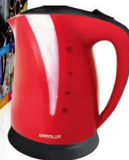
13 116 / ELX-KP03-C73 вишнево-св.серый