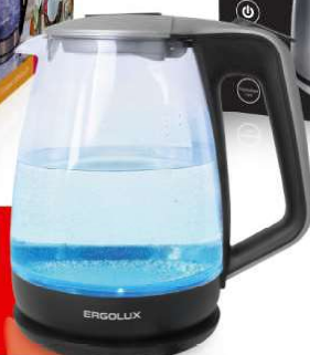
13 117 / ELX-KG01-C42 серебристо-черный