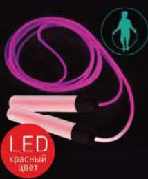
14 745 / J2LED [скакалка гимнастическая со световым эффектом, красная]