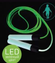
14 749 / J3LED [скакалка гимнастическая со световым эффектом, зеленая]