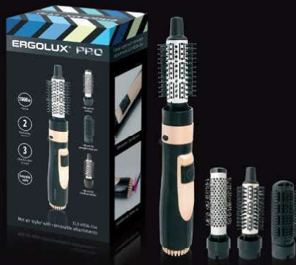
13 134 / ELX-HD04-C64 черный/золото PRO (фен-расческа с 3 насадками, 1000Вт, 220-240В)