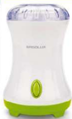
13 977 / ELX-CG01-C34 бело-салатовая