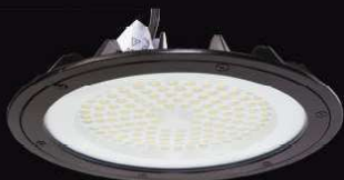
14 959 / HBL-1000 [(Свет. промышленный High Bay, 100w, 0,9pf) 14 960 / HBL-1500 (Свет. промышленный High Bay, 150W)