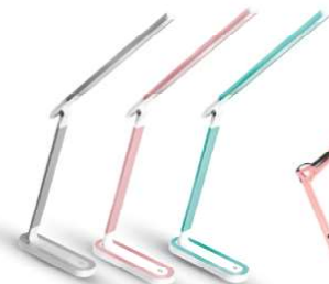
14152 / Camelion KD-845 C03 14153 / Camelion KD-845 C14 14154 / Camelion KD-845 C16