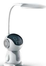
13008 / Camelion KD-858 C01