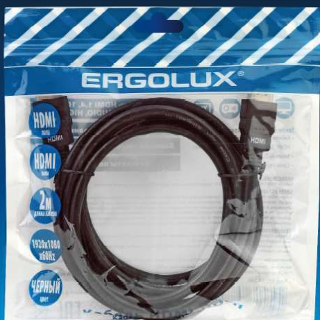
15296 / ELX-VC01P-HDMI