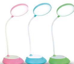
14468 / Ultraflash UF-744 C05 14470 / Ultraflash UF-744 C13 14471 / Ultraflash UF-744 C14