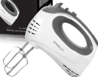
13 443 / ELX-EM02-C31 бело-серый PRO