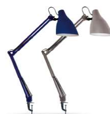
13877 / Camelion KD-335 C23 13878 / Camelion KD-335 C26