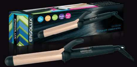
14 366 / ELX-C103-C64 черный/золото, 32 мм (щипцы для завивки волос, 23Вт, 220-240В)