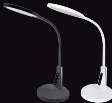
13 887 / KD-836 C01 белый 13 888 / KD-836 C02 черный LED(Свет-к наст.7Вт,230В,450лм, сенс.рег.ярк и цвет.темп,USB-5В,1А )