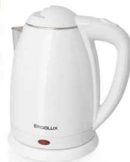
13 122 / ELX-KS02-C01 белый