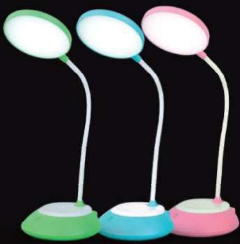
14 468 / UF-744 C05 зеленый 14 470 / UF-744 C13 голубой 14 471 / UF-744 C14 розовый [Led, светильник настольный, 6Вт, 3 цвет.темп., димм., аккумуля.]