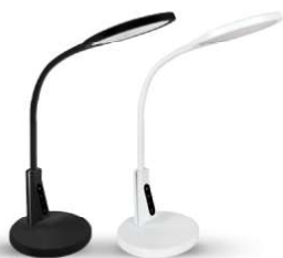
13887 / Camelion KD-836 C01 13888 / Camelion KD-836 C02