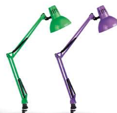
12339 / Camelion KD-312 C05 12341 / Camelion KD-312 C12