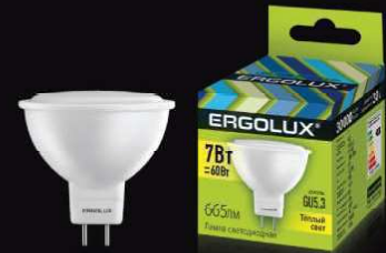
12 158 / LED-JCDR-7W-GU5.3-3K [Эл.лампа светодиодная JCDR 7Вт GU5.3 3000К 180-240В]